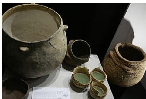
Creuset d'eau, céramique de Sophie Peynet-Chaveau et collection Préhistoire du Mumig

entrent en résonance avec celles de la Préhistoire et de l'Antiquité. Le costume d'Emma Calvé vient, quant à lui, questionner celui de la diva contemporaine Beyoncé conçu par la Maison On aura tout vu et les gants réalisés par la Maison Fabre.