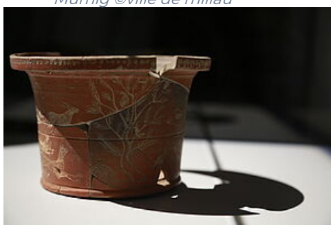
La coupe de Phoebus Collection Antiquité gallo-romaine du Mumig

Nous avons également pris le parti d' éclairer les zones d'ombre . L'absence d'objets ne signifie pas, en effet, celle de récits. Mais comment évoquer des réalités, des événements à partir de traces inexistantes ? La fresque des impensés réalisée par