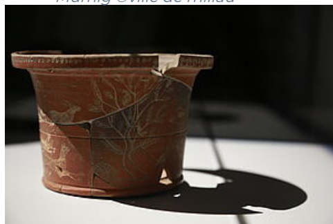
La coupe de Phoebus Collection Antiquité gallo-romaine du Mumig

Nous avons également pris le parti d' éclairer les zones d'ombre . L'absence d'objets ne signifie pas, en effet, celle de récits. Mais comment évoquer des réalités, des événements à partir de traces inexistantes ? La fresque des impensés réalisée par