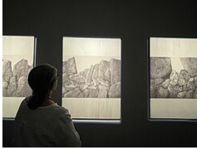
Sans titre, Jean-Michel Prêt