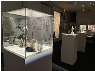
Le sang des Bêtes, 2023 Nicolas Daubanes