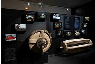
session mégisserie @underkult

- Une approche des notions de geste et de savoir-faire envisagés comme réponses possibles face à l'instabilité qui semble qualifier le monde contemporain.