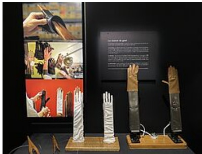
Photographies Sans Titre, Philémon d'Andurain ©Sarah- Thuault-Ney -

- Une approche des notions de geste et de savoir-faire envisagés comme réponses possibles face à l'instabilité qui semble qualifier le monde contemporain.