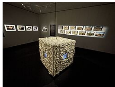
W3 (Wool Cube), 2023, Brice Morel - Photographies Terre, 2018, Éric Bourret et Sans titre, Philémon d'Andurain.

- Une présentation générale de l'économie ovine replacée dans son contexte paysager et une évocation des problématiques écosystémiques auxquelles les différentes filières se trouvent confrontées ;