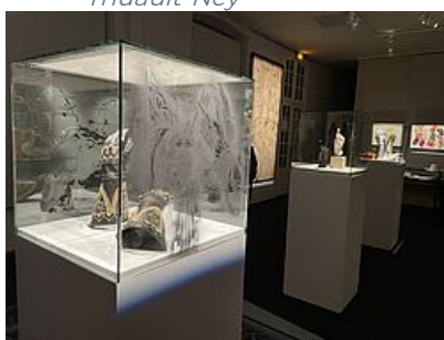
Le sang des Bêtes, 2023 Nicolas Daubanes