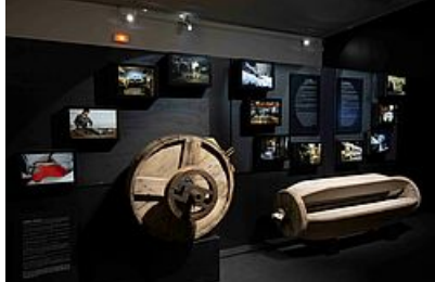
session mégisserie @underkult

- Une approche des notions de geste et de savoir-faire envisagés comme réponses possibles face à l'instabilité qui semble qualifier le monde contemporain.