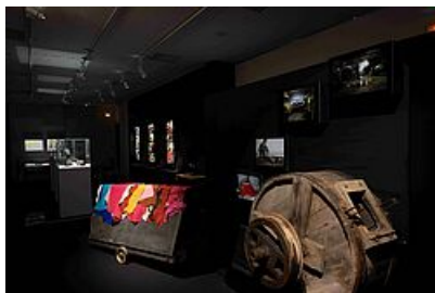
session mégisserie @underkult

- Une plongée dans le monde de la mégisserie et de la ganterie millavoises à travers une sélection d'objets, outils et artefacts encore utilisés aujourd'hui ;