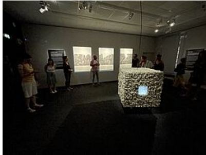
W 3 (Wool Cube), 2023, Brice Morel - Sans titre, Jean-Michel Prêt

- Une plongée dans le monde de la mégisserie et de la ganterie millavoises à travers une sélection d'objets, outils et artefacts encore utilisés aujourd'hui ;