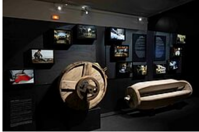
session mégisserie

- Une approche des notions de geste et de savoir-faire envisagés comme réponses possibles face à l'instabilité qui semble qualifier le monde contemporain.