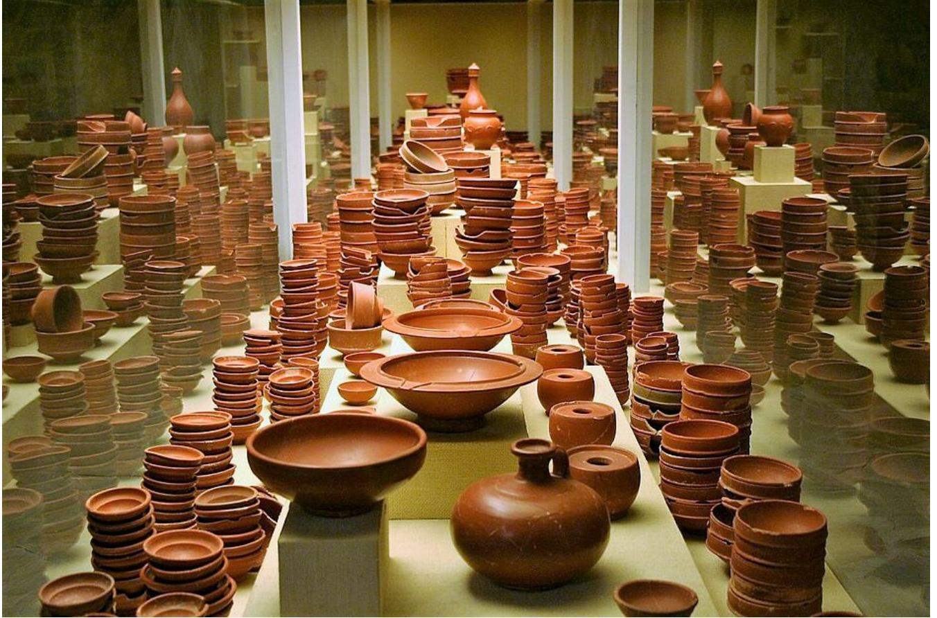
Vitrine de céramiques sigillées romaines produites sur le site de la Graufesenque