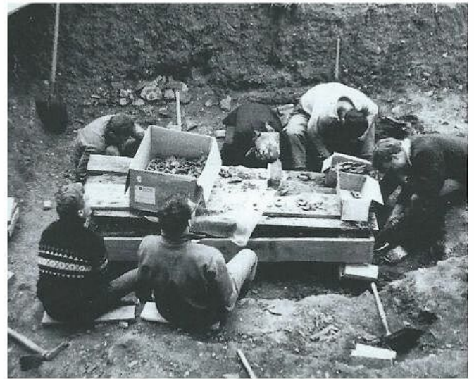
Fouilles 1953, 1950, 1965

Depuis les années 1980, dans le sous-sol voûté du musée, une partie importante du mobilier découvert est intégrée dans le parcours permanent dédié à l'archéologie côtoyant en autres les collections issues de sites protohistoriques.